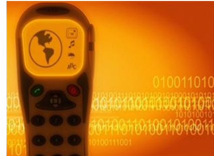
For BSNL's basic services, the maximum amount pending is against subscribers in Uttar Pradesh and Bihar.

Arrears for basic services far exceed the amount due on account of wireless services in the case of both the telcos. For BSNL's basic services, the maximum amount pending is against subscribers in Uttar Pradesh and Bihar. Circle-wise, basic service outstandings from the Delhi region are the highest.